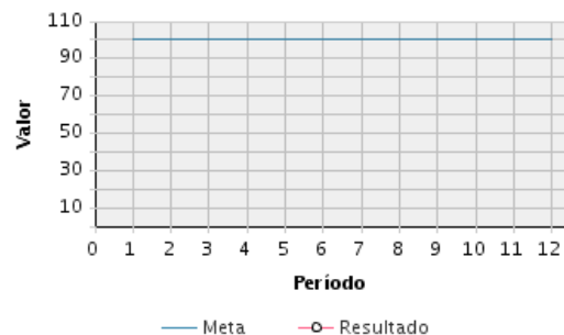
AVANCE FÍSICO PROGRAMADO VS. REAL

Transcurrido: 94.88 % Fecha de Inicio: 01/08/2012 Fecha de Fin: 31/12/2018