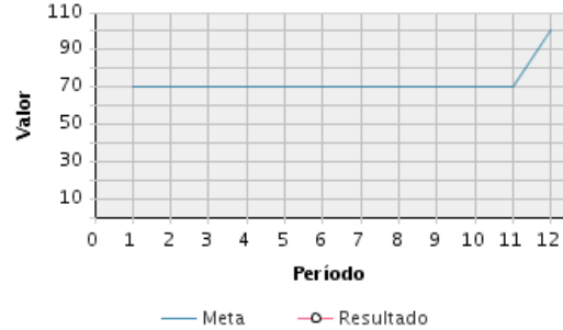
AVANCE FÍSICO PROGRAMADO VS. REAL

Transcurrido: 100.00 % Fecha de Inicio: 01/01/2012 Fecha de Fin: 31/12/2019