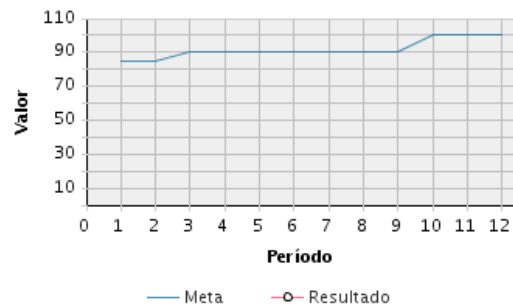
AVANCE FÍSICO PROGRAMADO VS. REAL

Transcurrido: 79.97 % Fecha de Inicio: 06/09/2018 Fecha de Fin: 31/12/2021