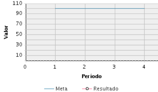
AVANCE FÍSICO PROGRAMADO VS. REAL

Transcurrido: 100.00 % Fecha de Inicio: 25/10/2012 Fecha de Fin: 30/04/2021