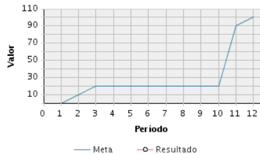
AVANCE FÍSICO PROGRAMADO VS. REAL

Transcurrido: 41.37 % Fecha de Inicio: 01/01/2021 Fecha de Fin: 31/12/2021