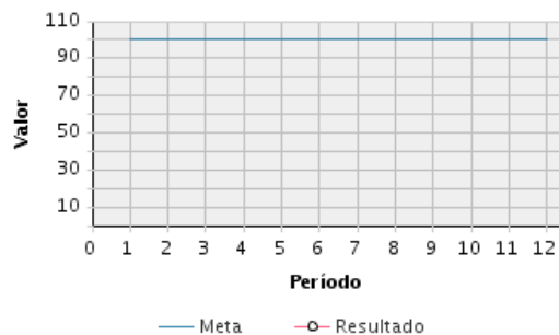
AVANCE FÍSICO PROGRAMADO VS. REAL

Transcurrido: 100.00 % Fecha de Inicio: 01/07/2012 Fecha de Fin: 31/12/2022