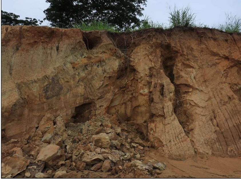
Fotografía de 7 de marzo de 2022