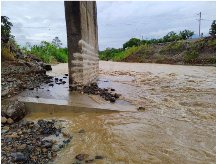
Fotografía de 7 de marzo de 2022