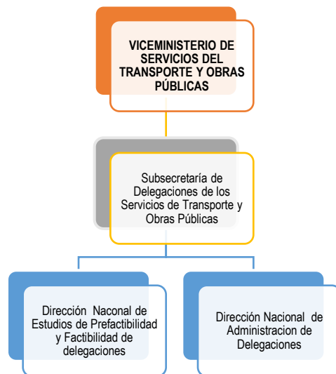
Gráfico 2 Estructura operativa