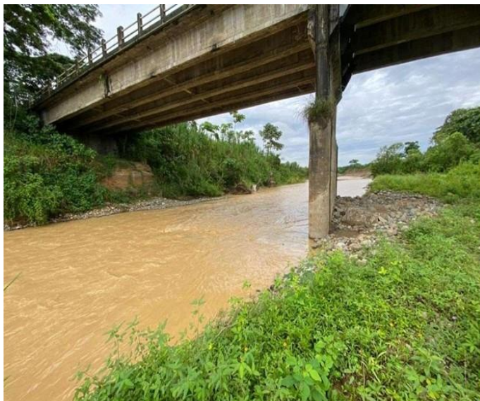
Fotografía febrero 2022. Socavación pila central.

Al igual como lo sucedido con el puente sobre el Río Gala, este puente también presentaba problemas estructurales detectados por las inspecciones permanentes de la empresa Concesionaria y comunicadas a la Subsecretaría de Delegaciones de los Servicios de Transporte y Obras Públicas. Adicionalmente, INTERVIAS, procedió a realizar trabajos de reparación emergentes.