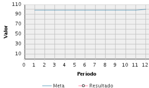
AVANCE FÍSICO PROGRAMADO VS. REAL

Transcurrido: 94.99 % Fecha de Inicio: 01/01/2009 Fecha de Fin: 31/12/2018