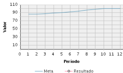
AVANCE FÍSICO PROGRAMADO VS. REAL

Transcurrido: 90.84 % Fecha de Inicio: 01/01/2011 Fecha de Fin: 31/12/2019