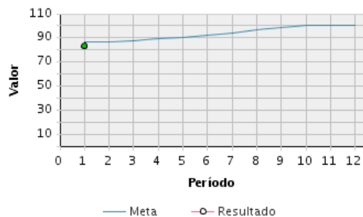
AVANCE FÍSICO PROGRAMADO VS. REAL

Transcurrido: 91.66 % Fecha de Inicio: 01/01/2011 Fecha de Fin: 31/12/2019