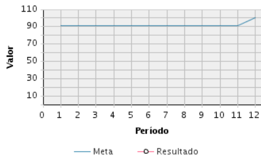
AVANCE FÍSICO PROGRAMADO VS. REAL

Transcurrido: 91.74 % Fecha de Inicio: 01/01/2011 Fecha de Fin: 31/12/2021