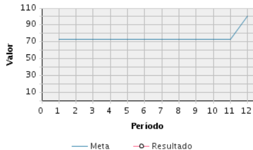
AVANCE FÍSICO PROGRAMADO VS. REAL

Fecha de Inicio: 01/01/2018 Fecha de Fin: 31/12/2021