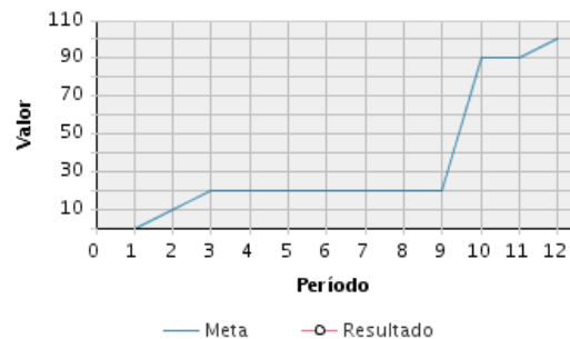
AVANCE FÍSICO PROGRAMADO VS. REAL

Transcurrido: 77.04 % Fecha de Inicio: 14/06/2019 Fecha de Fin: 31/12/2021