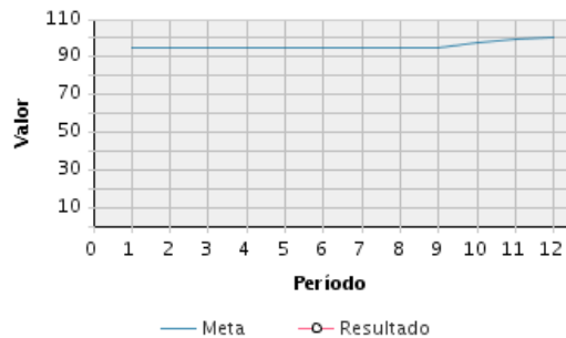
AVANCE FÍSICO PROGRAMADO VS. REAL

Transcurrido: 97.41 % Fecha de Inicio: 31/10/2018 Fecha de Fin: 31/12/2021