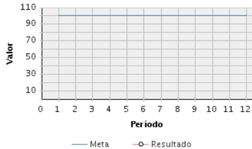
AVANCE FÍSICO PROGRAMADO VS. REAL

Transcurrido: 69.74 % Fecha de Inicio: 07/08/2013 Fecha de Fin: 31/12/2025