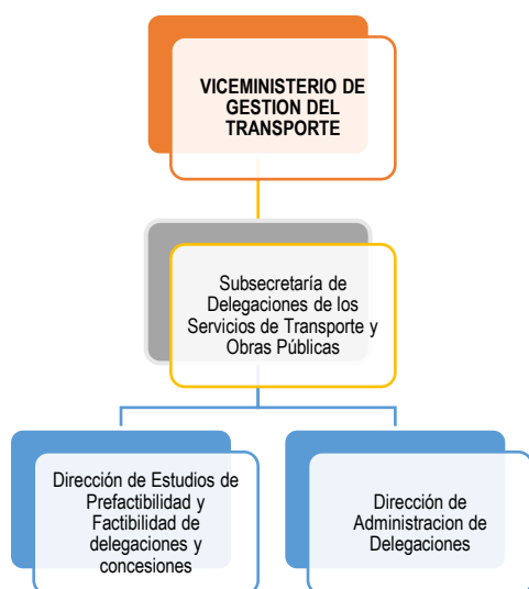
Gráfico 4 Estructura operativa